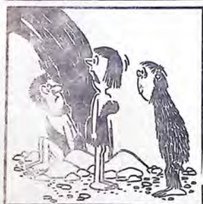
— Questo dice di essere tuo parente stretto...