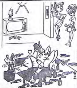
— Finalmente sono riuscita a fargli perdere il vizio del fumo!