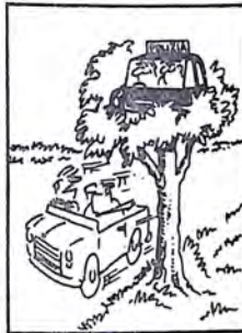
— Corro quanto mi pare, tanto non c'è nessun agente in vista!