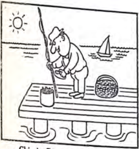
— Chi si offre volontario?

Il seguito di questa avvincente avventura lo troverete nella prossima puntata.