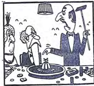
— Volete smetterla di ficcare la barba nella roulette?